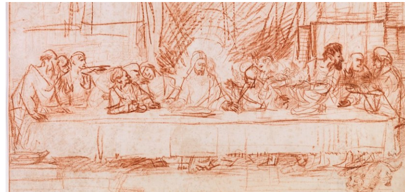
Jesus feiert mit seinen Jüngern das Passa, Rembrandt van Rijn

Aktivitäten. Statt gegen aussen richten diese Gemeinden den Grossteil ihrer geistigen Kraft auf sich selber. Mit gruppensdynamisch optimierten Angeboten wollen sie möglichst jedem den Raum geben, mit seinen Wirken für den Herrn wirksam zu werden.