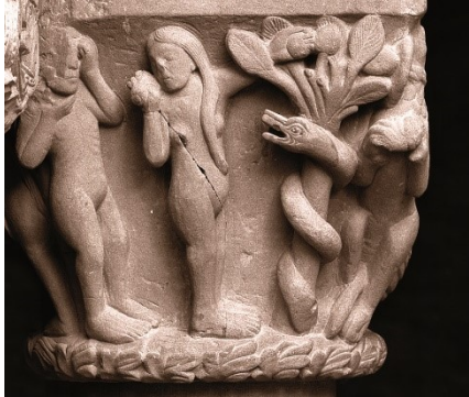
Wie kam die Lüge ins Paradies?

fähigere sich durchsetzen (wie das Marx, Nietzsche und Hitler in je anderer Weise angenommen haben).